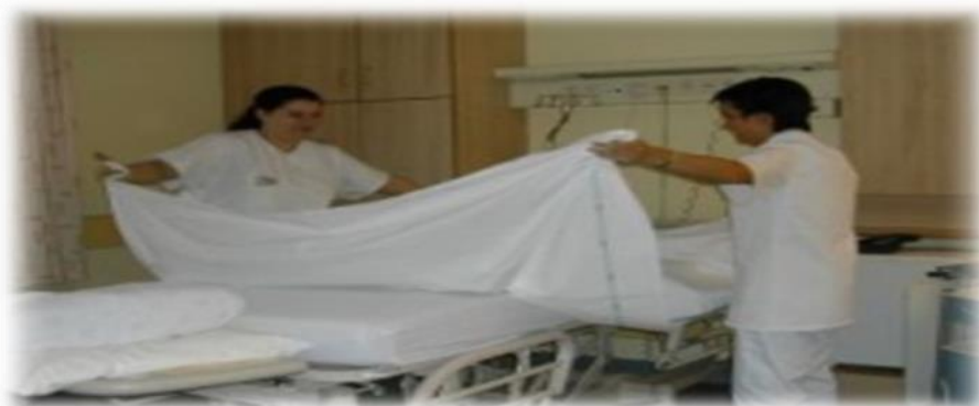
Fig. 1 Asistent medical generalist in stagiu