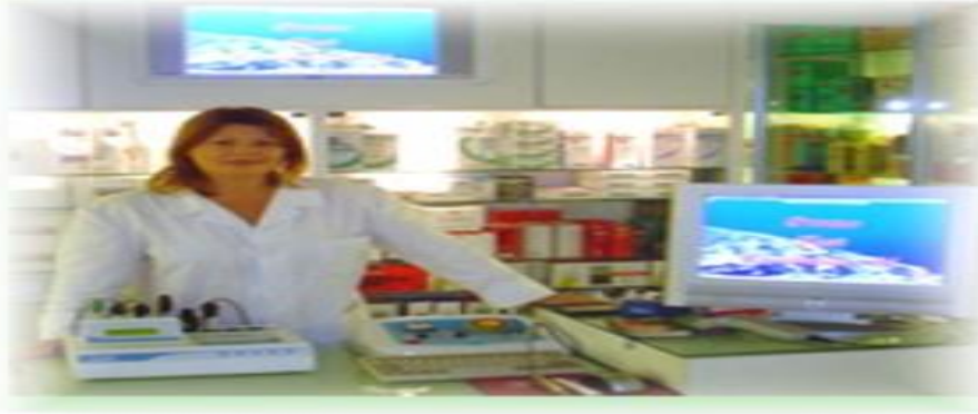
Fig. 2 Asistent medical de farmacie in stagiu